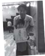
オリンピックからの 大事なメッセージもあるよ!